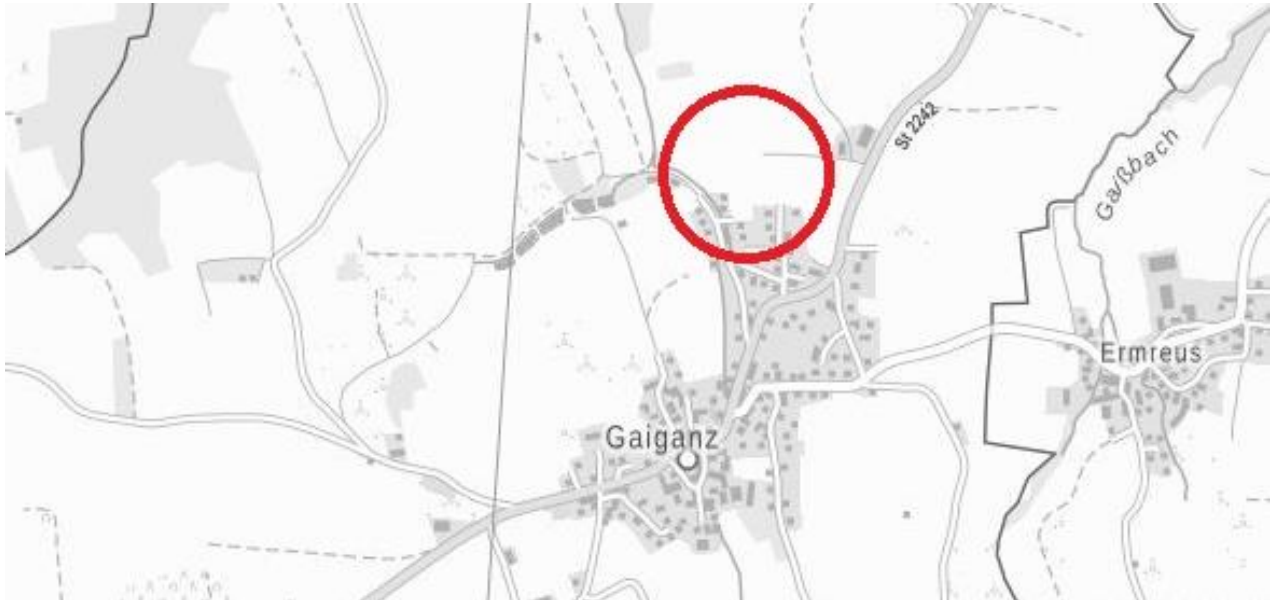
Übersichtslageplan mit Planungsbereich (s. Kreis), Quelle: BayernAtlas

Der Gemeinderat der Gemeinde Effeltrich hat am 11.09.2023 beschlossen, für einen Bereich im Norden des Ortsteil Gaiganz den Bebauungsplan „Gaiganz Nord 1“ aufzustellen. Vorgesehen ist die Aufplanung eines Allgemeinen Wohngebietes. Die Lage des Planungsbereichs kann dem nachfolgenden Übersichtslageplan entnommen werden.